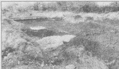
Следы пребывания тяжелой техники