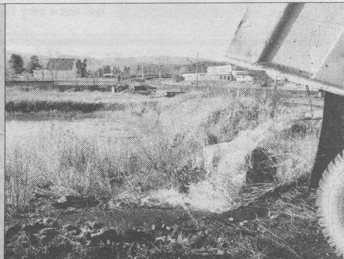
В городе объявлен режим ЧС. ЖБО сливаются прямо на землю