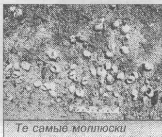
Те самые моллюски

Кроме того, мы обнаружили безумное количество остатков моллюсков. Они не исконо байкальские и принадлежат к роду полиарктических прудовиков. Такого их количества мы в жизни не видели! Скорее всего, они кушают ту самую спирогиру, но поскольку еды у них столько много, они не справляются и отмирают. Однако это только предварительные впечатления. Делать выводы можно будет только после прове-